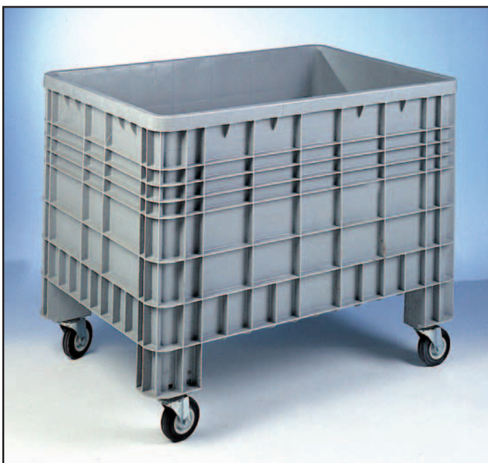
CONTENITORE PLASTICA 600 Lt. con ruote girevoli Ø 106x40.