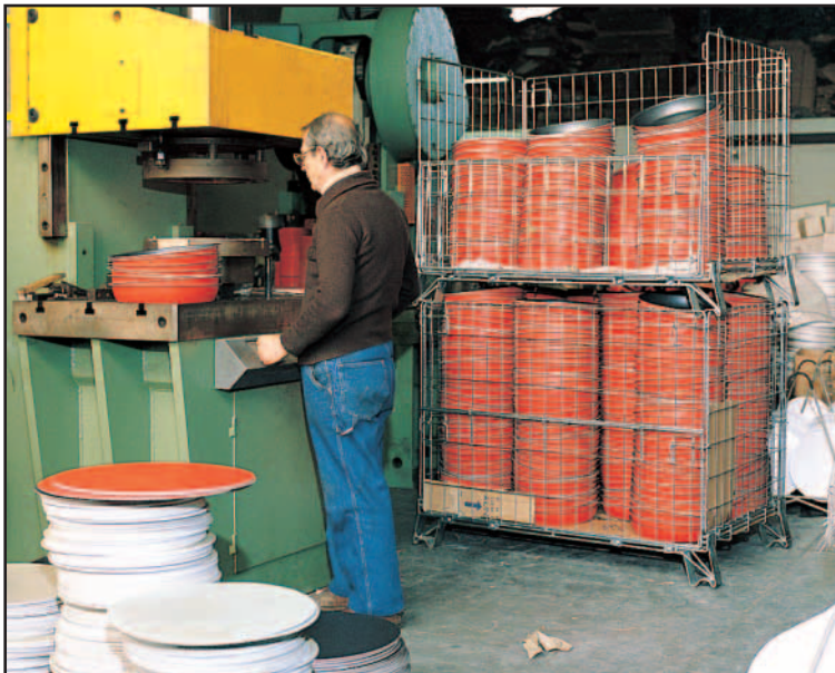
CONTAINER P 800 in einer Hauswarenfabrik.

20 Stück können in einem Quadratmeter gestapelt werden.